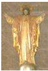
Imagen en Monasterio Carmelitas Descalzas Valladolid