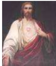
Imagen en el Santuario de Kalwaria (Polonia)

De igual modo, por medio del Espíritu Santo, el amor del Corazón de Jesús se derrama en los corazones de los hombres (Rm 5, 5) y los impulsa a la adoración de su «inescrutable riqueza» (Ef 3, 8) y a la súplica filial y confiada al Padre (Rm 8, 15-16), a través del Resucitado «siempre vivo para interceder en su favor» (Hb 7, 25).