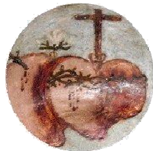
Floreçilla del Corazón de Jesús de Buenafuente

Quiero hablar de un Amor infinito, de un mensaje de Amor paciente y generoso. de la humilde flor que en el altar deposité, en el Corazón de Jesús la encontré. de un Amor que busca y llama al Encuentro, quiero hablar del Corazón de Jesús.