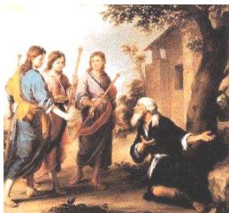
Encina de Mambré